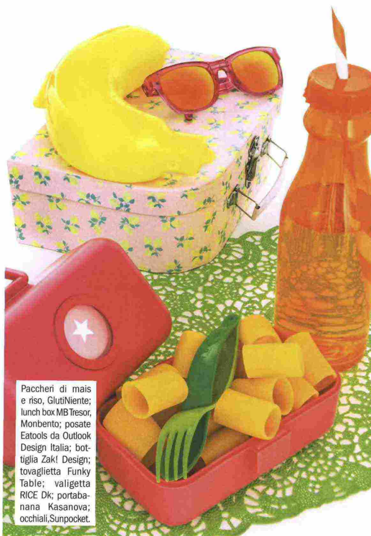
Paccheri di mais e riso, GlutiNiente; lunch box MB Tresor, Monbento; posate Eatools da Outlook Design Italia; bottiglia Zak! Design; tovaglietta Funky Table; valigetta RICE Dk; portabambina Kasanova; occhiali, Sunpocket.